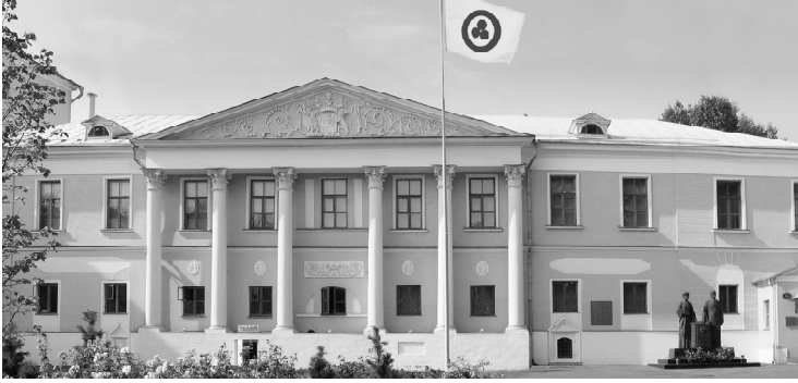
Kansainvälisen Roerich-keskuksen Nikolai Roerich -museon päärakennus (entinen Lopuhinien kaupunkikartano) nykyään.

”Yhdessä me ylitimme kaikenlaiset esteet. Ja esteet muuttuivat mahdollisuuksiksi”, Nikolai kirjoitti liitostaan Helenan kanssa vanhoilla päivillään. Nikolai nimitti puolisoaan Druginjaksi , jossa ainakin artikkelin kirjoittajien korvaan kuuluvat venäjän sanat drug – ystävä ja boginja – jumalatar. He olivat toisilleen enemmän kuin vain aviopuolisot. Kaikki minkä he loivat, oli tulosta yhteistyöstä ja keskinäisestä syvästä vuorovaikutuksesta, jopa siinä määrin, että Nikolain mielestä hänen tauluillaan olisi tullut olla kaksi nimeä, toinen miehen ja toinen naisen.